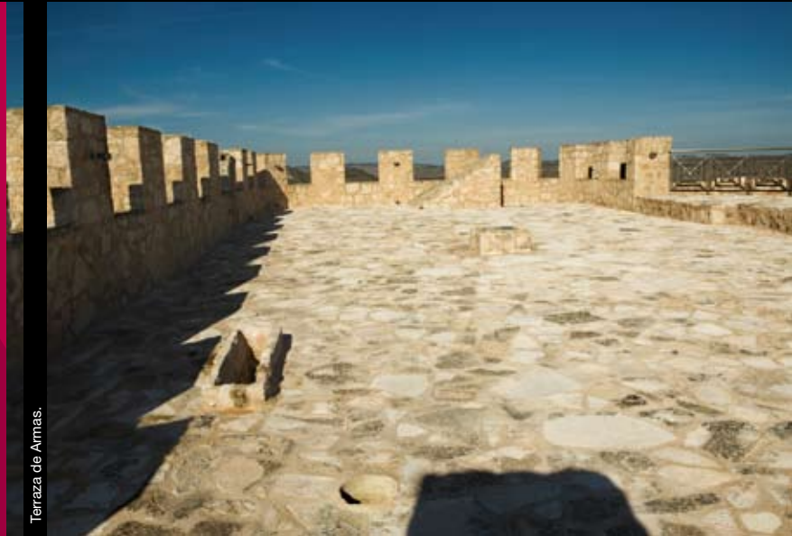
Terraza de Armas.