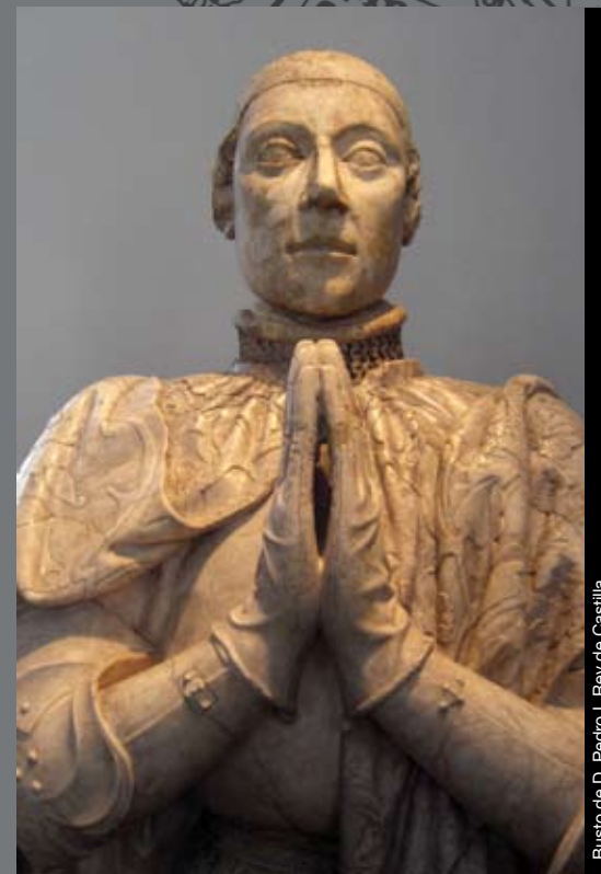
Busto de D. Pedro I, Rey de Castilla.

The Cardinal Belluga gathered the loyal troops of the Borbon family in the castle of Jumilla, from here the troops departed for the battle of Almansa. Felipe V, was very grateful for the help of Jumilla.