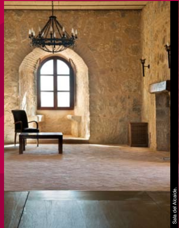
Sala del Alcaide.

In this room there was a door for entering the castle with a drawbridge and it was connected to the rooms at the top and bottom.