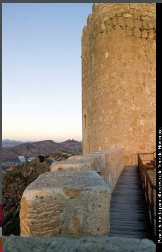
Passo de ronda para el acceso a la Torre del Homenaje.

Once finished the Castle's reconstruction Works, we had the need to improve access and create a recreation area around the castle. Jumilla Town hall presented in 2008. The works started thanks to the Spanish Economy and Employment Stimuln, Plan E, and wen finished by december 2009.