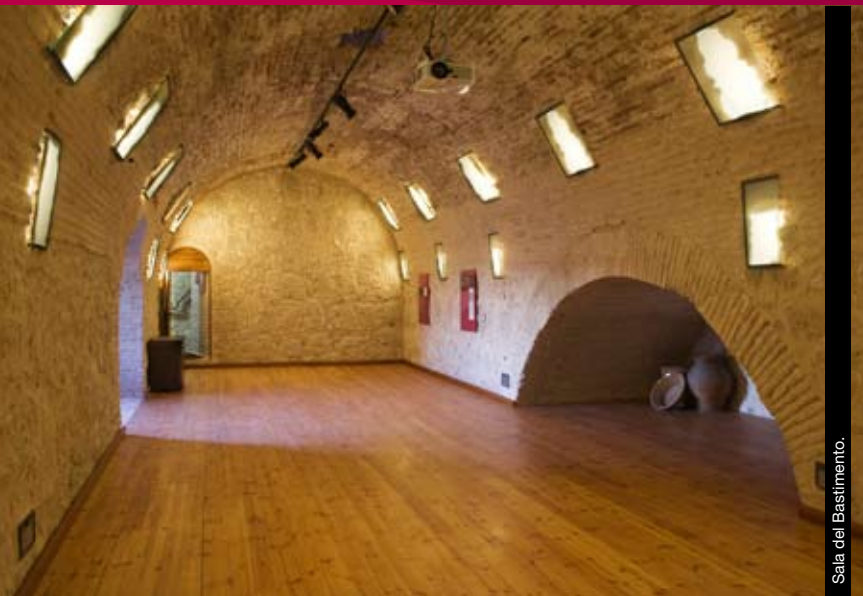
Sala del Bastimento.

On the ceiling there was an opening that led to the terrace to provide the ammunition and pieces of artillery more quickly to the upper floor.