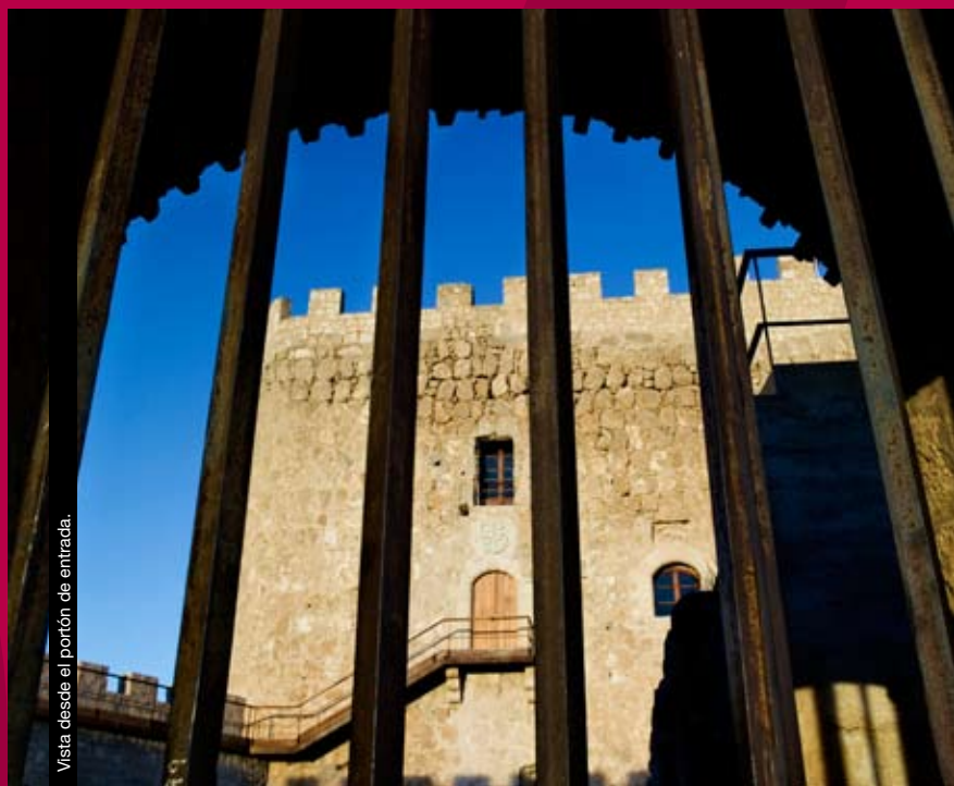
Vista desde el portón de entrada.

Nearby, some cannonballs have been found, part of the Bombarda munitions, also settled in the Weapons Ward.