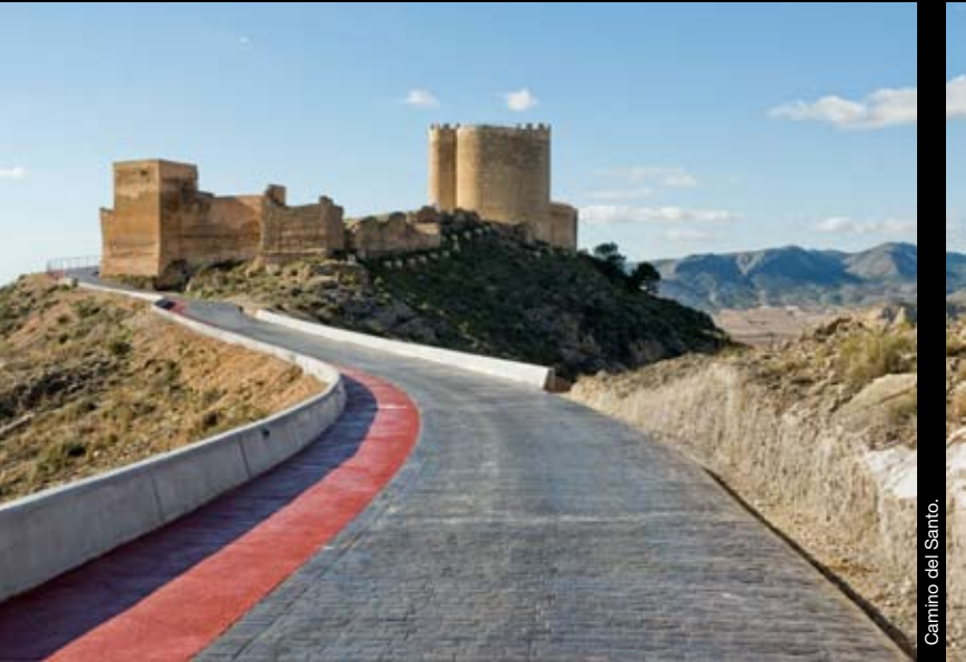
Camino del Santo.