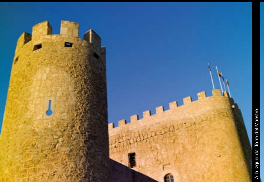
A la izquierda, Torre del Maestre.