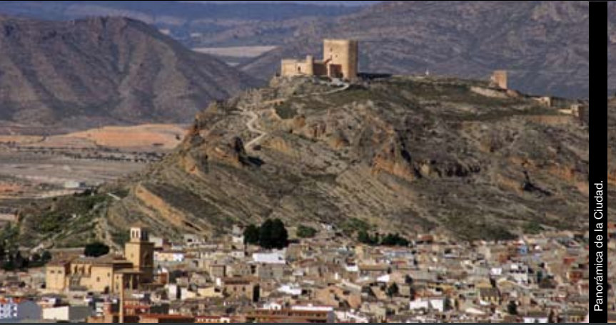
Panorámica de la Ciudad.