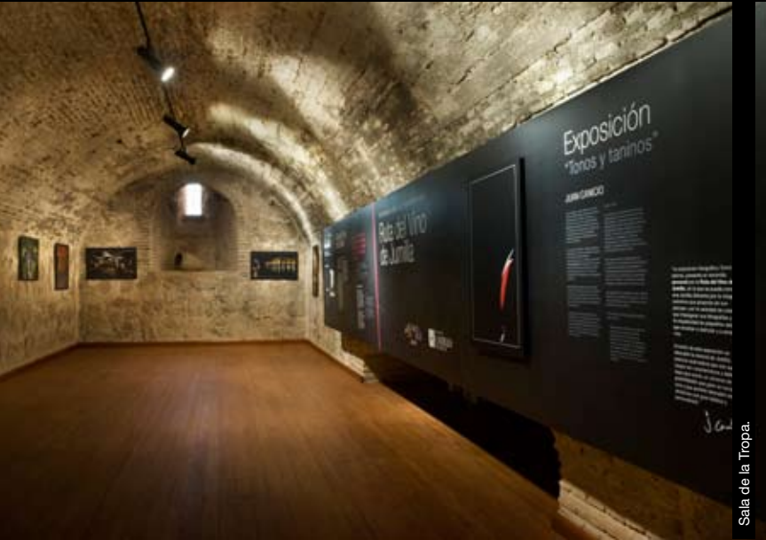
Sala de la Tropa.